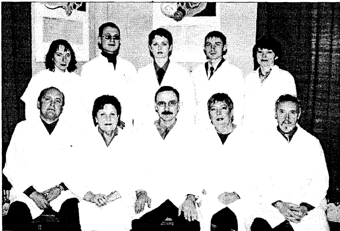
Колектив кафедри патологічної анатомії та судової медицини у 2002 році

Викладачі кафедри допомагали в підготовці кадрів для країн Азії та Африки, працюючи в університетах Замбії (професор