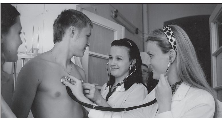
Що каже ваше серце, юначе?