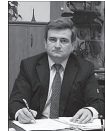
3 повагою ректор БДМУ – Тарас БОЙЧУК

Хай вам щастить, нехай вами керують гарні наміри і людяні мотиви. Будьте вірними професії медика і рідній державі!