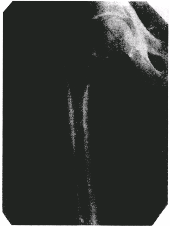
Рис. 3. Рентгенограма правої стегнової кістки хворого Л. до операції.

Клінічні приклади тотального ендопротезування запропонованою конструкцією. Хворий Л., 74 років, історія хвороби №3838, пенсіонер, поступив в клініку 20.04.03р. через 2 години після падіння на сходах із закритим внутрішньосуглобовим переломом шийки правої стегнової кістки (рис.3). В день поступлення після проведеного обстеження хворому було виконано тотальне цементне ендопротезування кульшового суглоба, тому що під час оперативного втручання виявлено дефект хряща кульшового суглоба (рис.4). 21.04.03р. пацієнт почав ходити на милицях. На 9 день хворий виписаний на амбулаторне лікування. Оглянутий через 2,5 та 11 місяців після операції. Клінічно – повне відновлення функції оперованої кінцівки. Рентгенологічно – положення ендопротезу добре.