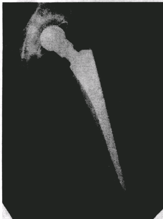
Рис. 6. Рентгенограма лівої стегнової кістки хворої Г. на 3-й день після операції.

Результати лікування хворих оцінювались за трибальною системою: добре, задовільно, незадовільно. За основу оцінки результатів лікування переломів шийки та вертлюгової ділянки стегна у