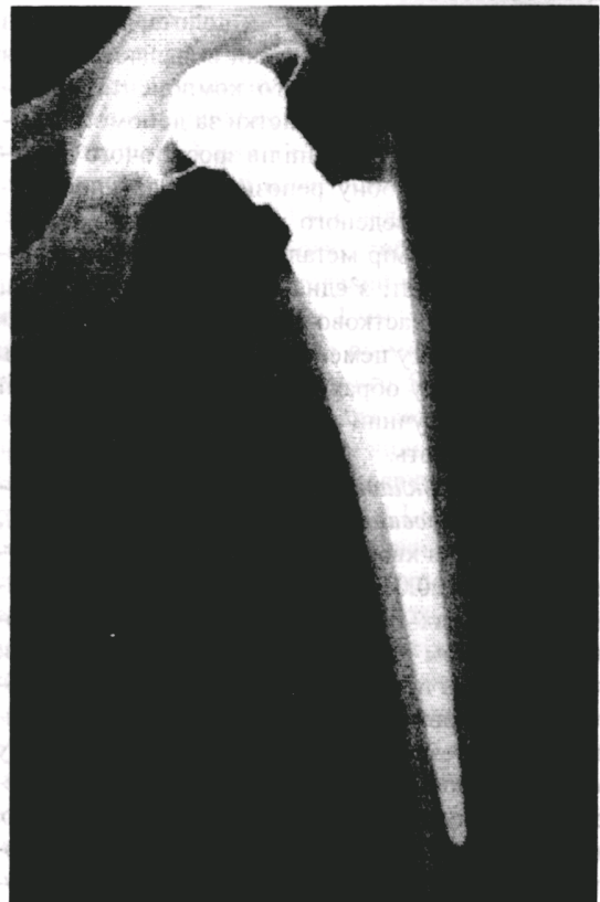
Рис. 7. Рентгенограма лівої стегнової кістки хворої Г. через 11 місяців після операції.