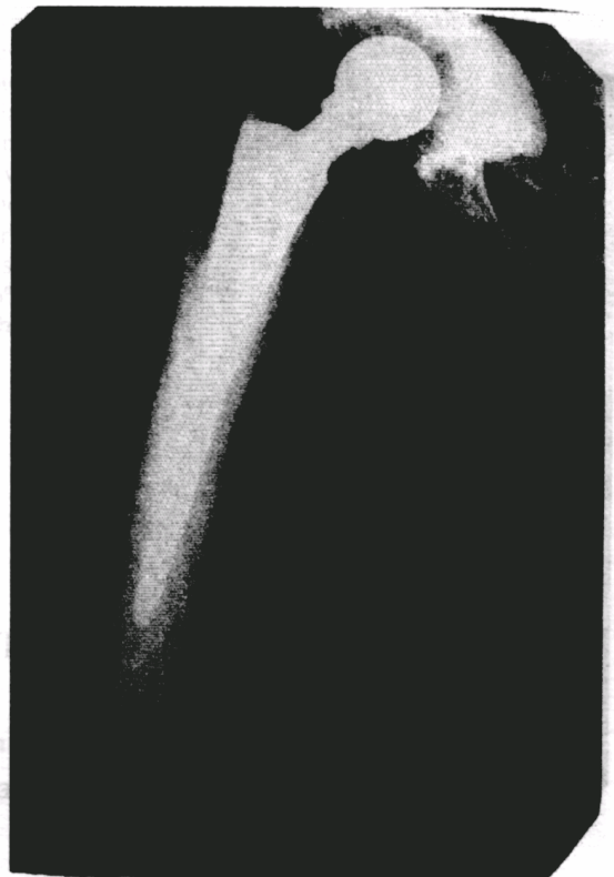
Рис. 4. Рентгенограма правої стегнової кістки хворого Л. на 2-й день після операції.