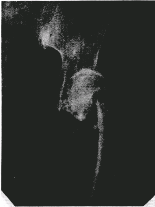
Рис. 5. Рентгенограма лівої стегнової кістки хворої Г. до операції.

Хвора Г., 84 роки, історія хвороби № 2101, поступила в клініку 12.02.02 р. із закритим субкапітальним переломом шийки лівої стегнової кістки через 8 години після падіння на лівий бік вдома (рис. 5). На рентгенограмах – ознаки остеопорозу та деформуючого артозу II ст.