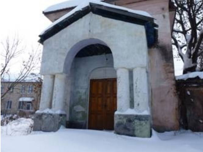
Мал. 2. Зовнішній вигляд та облаштування моргу Сокирянського міжрайонного відділення до 2011

Сокирянське міжрайонне відділення до грудня 2011 року розташовувалось на території Сокирянської ЦРЛ. Кабінет судово-медичного експерта знаходився в приміщенні поліклініки, а морг в пристосованому приміщенні старої каплиці (мал. 2).