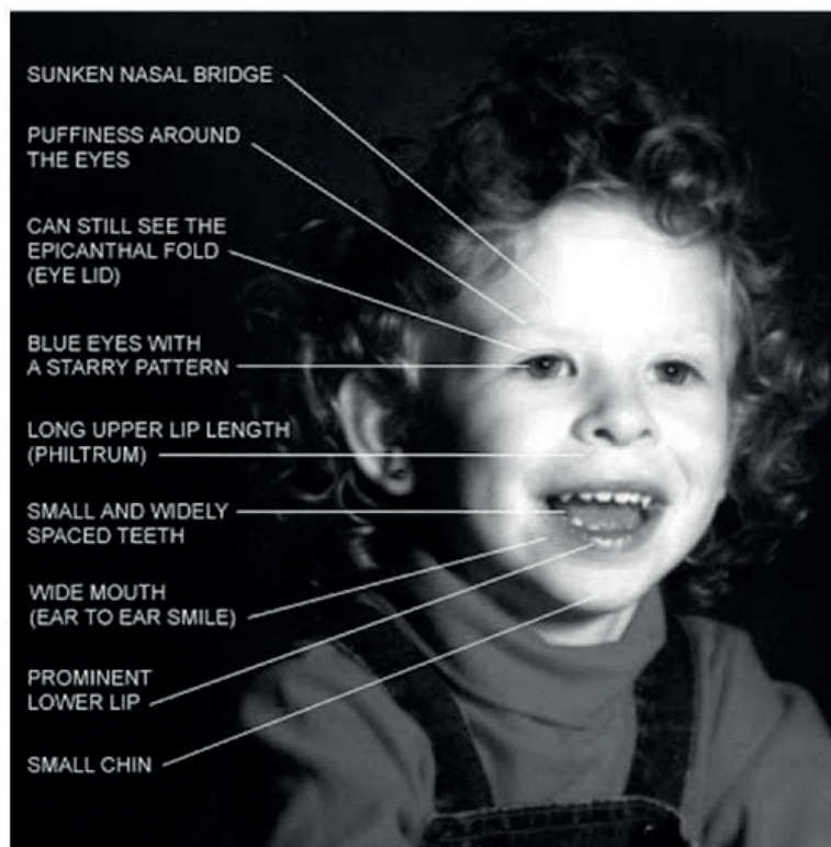
Fig. 2. Phenotypic signs of Williams-Beuren syndrome [23]

Vision and Hearing. During childhood, patients may have otitis media and visual problems. Blue iris with star pattern, strabismus (50 %), short palpebral fissures, amblyopia, refractive errors and pathological tortuosity of retinal vessels are common [13]. Increased sensitivity to sound is observed in 90 % of patients with WBS, progressive sensorineural hearing loss in 63 %; hyperacusis,odynacusia, auditory allodynia have also been described [5, 8, 22].