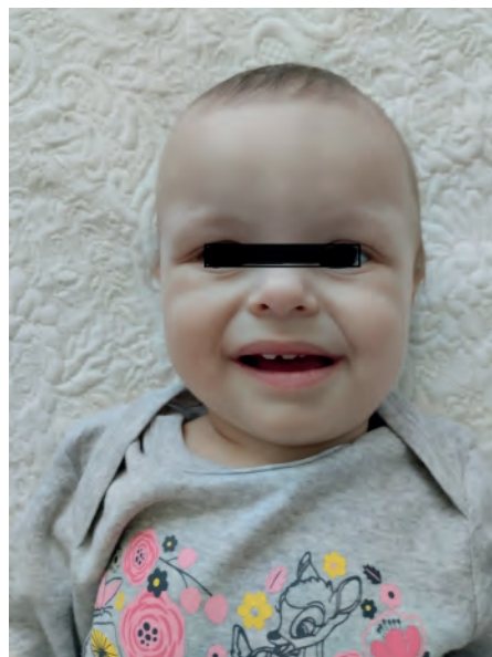
Fig. 3, 4. Phenotypic signs of WBS in monozygotic twins

According to ultrasound, both girls have the following congenital malformations: stenosis of the pulmonary artery, patent foramen ovale, and an additional spleen. Blood biochemistry: hypercalcemia.