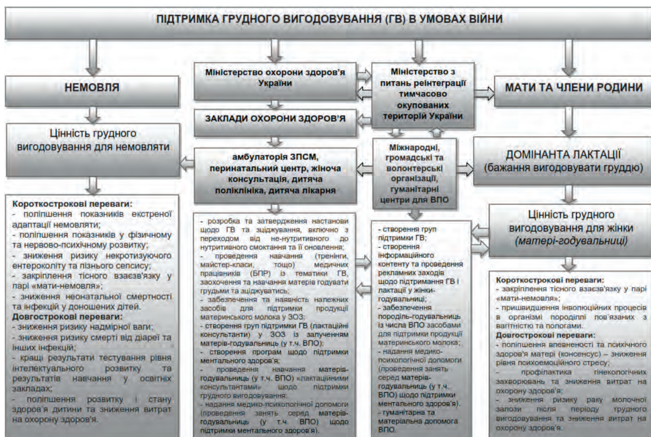
Рис. 2. Методологія формування підтримки ГВ в умовах війни (власна ілюстрація)

Узагальнюючи вище зазначене та відповідно до поставленої мети дослідження нами пропонується методологія формування підтримки ГВ в умовах війни (рис. 2).