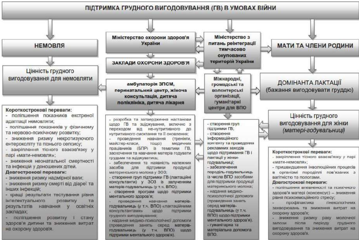
Рис.2 Методологія формування підтримки ГВ в умовах війни (власна ілюстрація)