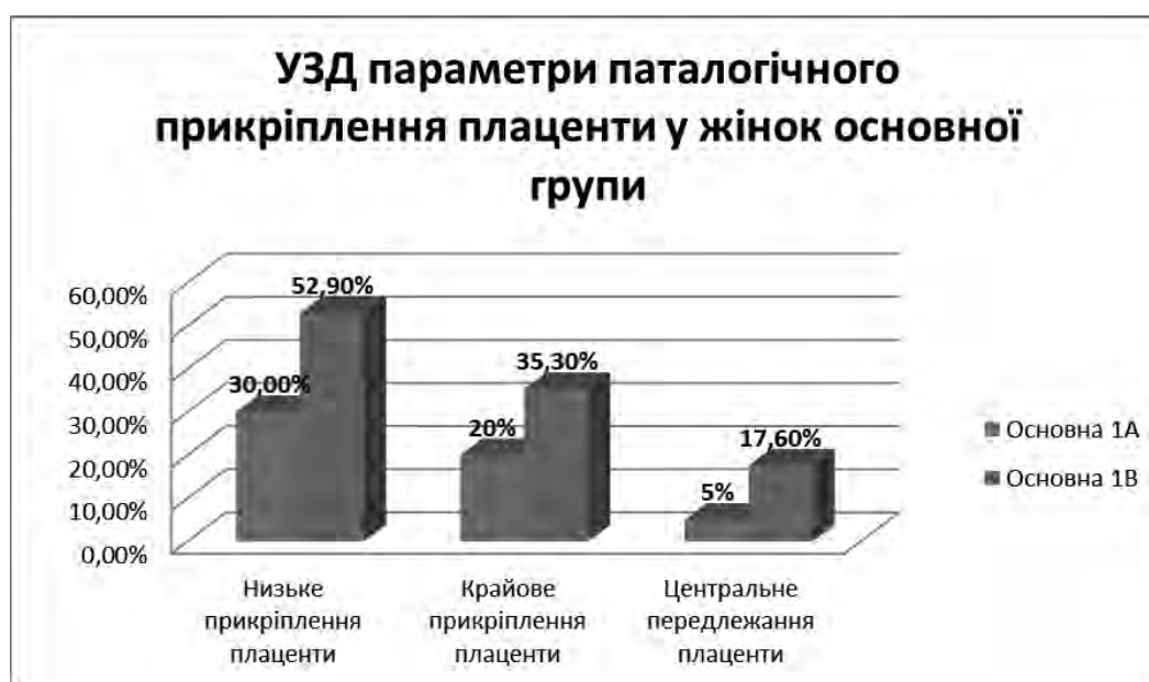
Рис. 2. УЗД параметри паталогічного прикріплення плацент у жінок основної групи

Діагностовано низьке прикріплення плаценти значно частіше у вагітних основної групи, ніж у вагітних контрольної – відповідно 17 (45,9±6,0 %) та 3 (8,6±4,2 %) – p=0,004 за критерієм кутового фі-перетворення Фішера. Слід зазначити, що дана патологія зустрічалась значно частіше у жінок ІВ підгрупи в порівнянні з жінками ІА підгрупи, а саме: 6 (30±4,1 %) у жінок ІА підгрупи проти 9 (52,9±3,2 %) жінок ІВ підгрупи основної групи. При цьому крайове передлежання відмічали у жінок основної групи ІВ підгрупи у 6 спостереженнях (35,3±3,8 %) проти у 4 (20±2,5 %) у жінок ІА підгрупи, центральне передлежання ІА – 1 (5 %), ІВ – 3 (17,6 %), а у жінок контрольної групи не було зафіксовано жодного випадку – p=0,180 (рис. 2).