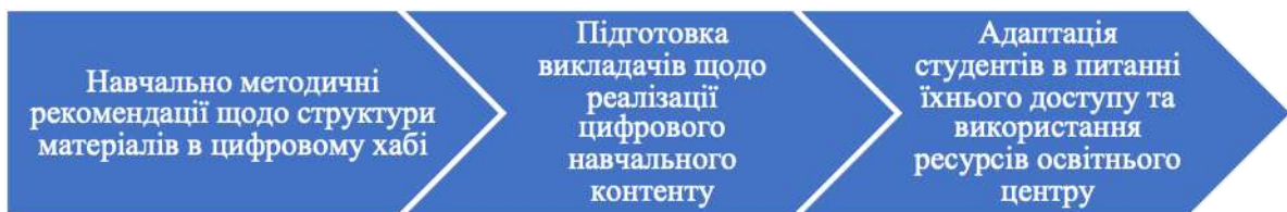
Рис. 2. Напрями навчального кластеру роботи цифрового освітнього хабу.

кластери. Коли ж йдеться про навчальний складник, то тут варто актуалізувати такі наукові дослідження (див. рис. 2).