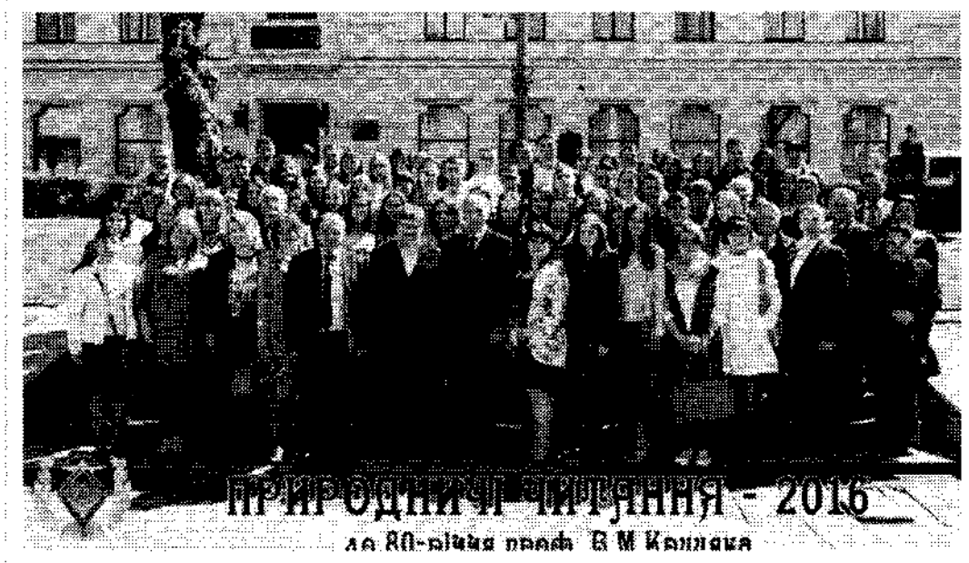
III Міжнародна науково-практична конференція (м. Чернівці, 19-22 травня 2016 року "Природничі читання", присвячена 80-річчю від дня народження видатного вченого-морфолога, професора В.М. Круцяка.