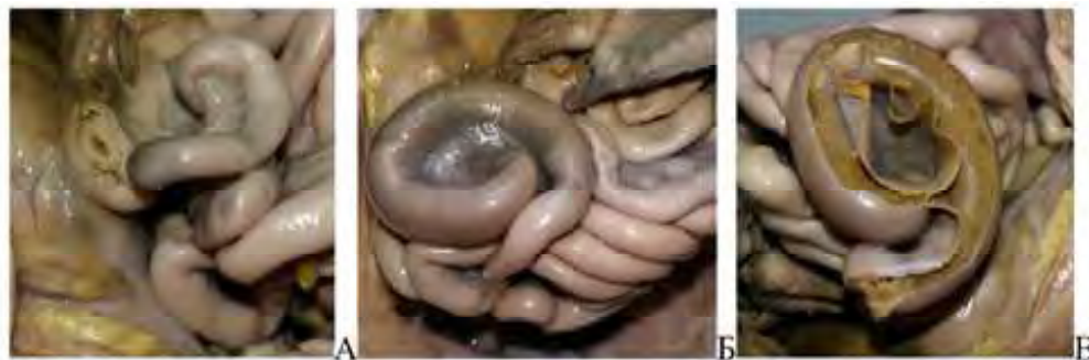
Рис. 3. Кишечник плода 280 мм ТПД. А. - округлий клубовий сосочок притаманний плодам 4-го місяця; Б. - ішемізована та розширена ділянка клубової кишки; В. - просвіт та вміст клубової кишки (стінка кишки розігнута)

ше ділянки обтурації й до клубового сосочка значно стоншена. Діаметр товстої кишки так само не відповідає морфометричним параметрам характерним плодам 6-го місяця. Можемо припустити, що дані морфологічні особливості є наслідком відсутності достатнього контакту меконія з клубовим сосочком і як наслідок відсутності його формоутворювальної дії на клубово-сліпокишковий сегмент.