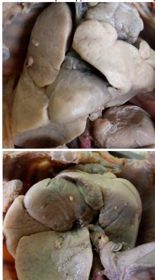
Рисунок. Внутрішні органи плода людини, 370 мм ТКД. Макропрепарат

Тимус- морфологічно не змінений. Скелетотопічно залоза проектується зверху на 0,5 сантиметрів над ручкою груднини, внизу досягає 3-го ребра. Синтопічно шийна частина залози знаходиться за грудино-щитоподібними м'язами, груднино-під'язиковими м'язами. Задня поверхня залози прилягає до бічної поверхні трахеї. Грудний відділ передньою поверхнею прилягає до бічного краю задньої поверхні груднини. Нижня поверхня