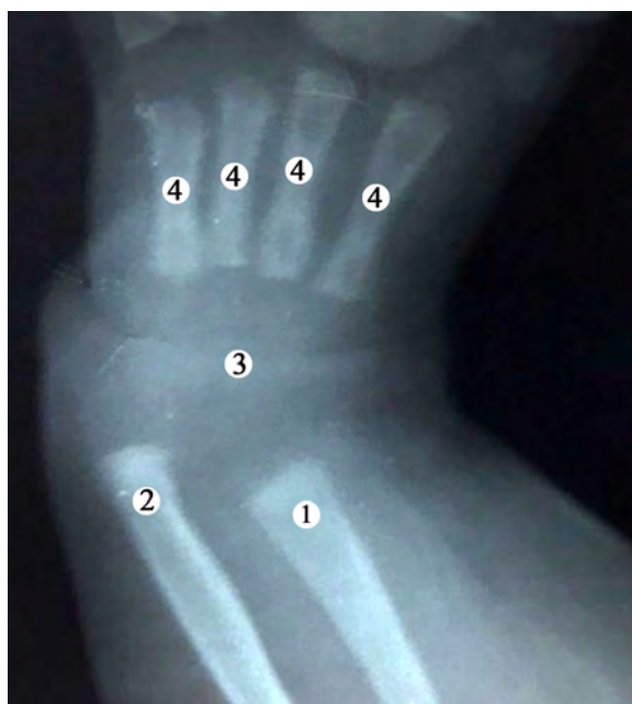
Рис. 2. Рентгенограма передпліччя та кисті 3-місячної дитини (відсутня I п'ясткова кістка): 1 – дистальний відділ променевої кістки; 2 – дистальний відділ ліктьової кістки; 3 – зачаток центрів скостеніння в човноподібній, півмісяцевій, тригранній, трапецієподібній, головчастій та гачкуватій кістках; 4 – п'ясткові кістки (II, III, IV, V)

Центри скостеніння в кістках зап'ястка ледве помітні. Виявлена відсутність I п'ясткової кістки, однак проксимальна та дистальна фаланги великого пальця визначаються. Також визначаються проксимальна, середня та дистальна фаланги II–V пальців кисті. Слід зазначити, що між чотирма п'ястковими кістками та проксимальними фалангами пальців кисті визначається значний проміжок, що свідчить про відсутність з'єднань (суглобів) між ними.