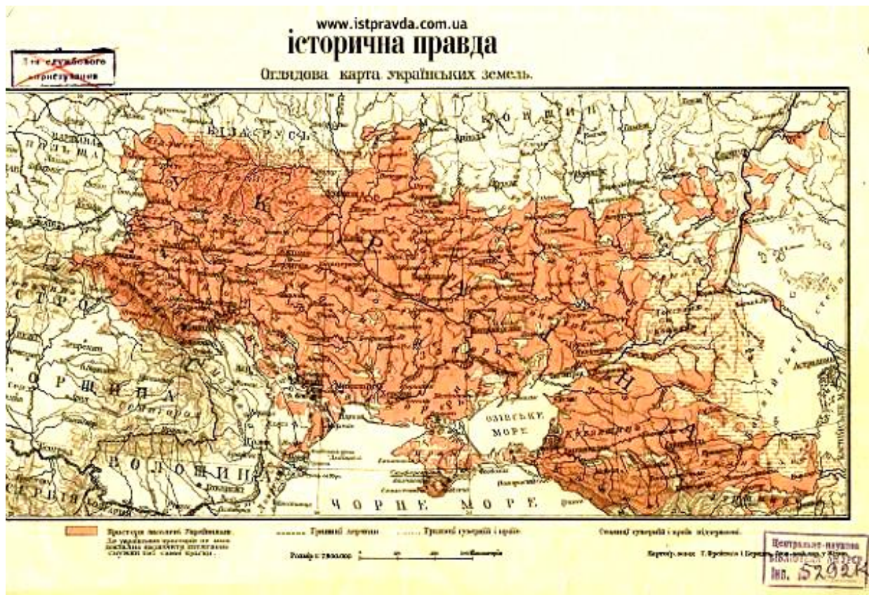
Оглядова мапа етнічних українських земель. Призначалася тільки для обмеженого службового використання.