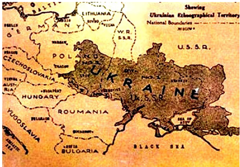
Мапа етнічних українських земель. На ній показано пунктиром регіони України, які були включені після Першої світової війни (1914 – 1918) до складу Росії, Польщі, Румунії, Чехословаччини. Із книги: «Ланселот Лоутон. Українське питання» (Київ-Лондон, 2006).

Лише побіжний погляд на мапу дає підстави констатувати, що Україна – дуже ласий шмат Європи. Вона розташована між двома великими системами гір – Кавказом і Карпатами. На сході Україна межує з Азією, на заході втискається в Центральну Європу, а на півдні з чорноморських берегів має доступ до Середземноморського басейну. Мапа свідчить, що частина територій сучасних Польщі, Словаччини, Румунії, Молдови, Росії мала б належати Україні.